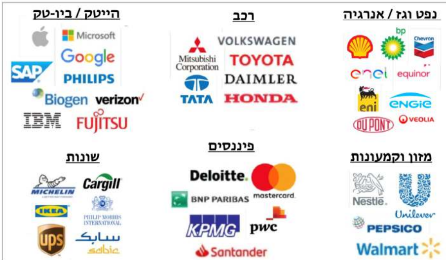
תרשים 3 40 תאגידים מתוך כלל התאגידים החברים במועצת העסקים העולמית לפיתוח בר קיימא, בחלוקה למגזרים, 2021

לקראת פסגת האקלים בריו, ב-1991, הוציאה מתוכה קהילת העסקים הגלובלית ארגון נוסף, ייעודי, שעד מהרה נטל את ההובלה על מהלך ההסטה: מועצת העסקים העולמית לפיתוח בר קיימא (World Business Council for Sustainable Development – WBCSD). חברי המועצה הם מנכ"לים של תאגידים טרנס-לאומיים מובילים מכל התעשיות בעולם, מעין מועצה מייצגת של המעמד הקפיטליסטי הטרנס-לאומי החותרת להתוות את גישתו של "גלובל ביזנס" לפוליטיקה סביבתית ומקדמת את האג'נדה הזאת בזירת ממשליות האקלים הגלובלית על בסיס משאביהם הכספיים והארגוניים העילאיים של חבריה. נכון להיום, המועצה מאגדת בתוכה מנכ"לים של 200 תאגידים שהכנסתם המצרפית היא 8.5 טריליון דולר ושמעסיקים 19 מיליון עובדים (תרשים 3).