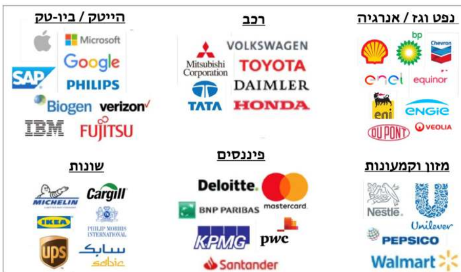
תרשים 3 40 תאגידים מתוך כלל התאגידים החברים במועצת העסקים העולמית לפיתוח בר קיימא, בחלוקה למגזרים, 2021 מקור: אתר מועצת העסקים העולמית לפיתוח בר קיימא – WBCSD .

לקראת פסגת האקלים בריו, ב-1991, הוציאה מתוכה קהילת העסקים הגלובלית ארגון נוסף, ייעודי, שעד מהרה נטל את ההובלה על מהלך ההסטה: מועצת העסקים העולמית לפיתוח בר קיימא (World Business Council for Sustainable Development – WBCSD). חברי המועצה הם מנכ"לים של תאגידים טרנס-לאומיים מובילים מכל התעשיות בעולם, מעין מועצה מייצגת של המעמד הקפיטליסטי הטרנס-לאומי החותרת להתוות את גישתו של "גלובל ביזנס" לפוליטיקה סביבתית ומקדמת את האג'נדה הזאת בזירת ממשליות האקלים הגלובלית על בסיס משאביהם הכספיים והארגוניים העילאיים של חבריה. נכון להיום, המועצה מאגדת בתוכה מנכ"לים של 200 תאגידים שהכנסתם המצרפית היא 8.5 טריליון דולר ושמעסיקים 19 מיליון עובדים (תרשים 3).